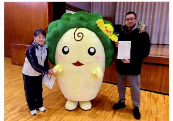
健康づくりマイスター表彰