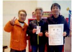
団体戦で連覇達成した五区豊町Cの選手の皆さん

大雪の影響が見込まれる中、ポップボウル柏崎で団体戦(混合チームを含む17チーム)、個人戦に総勢51名(うちレディース12名、小学生11名)がエントリーし、熱戦が繰り広げられました。