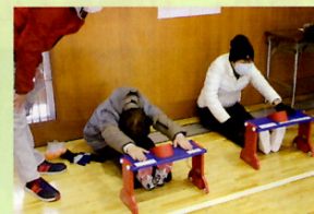
体力測定(長座体前屈)