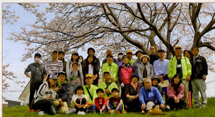
駅前公園テニスコート脇にて