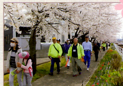
満開のよしやぶ川桜並木