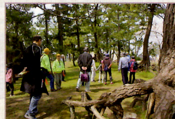
羽森神社根上がり松